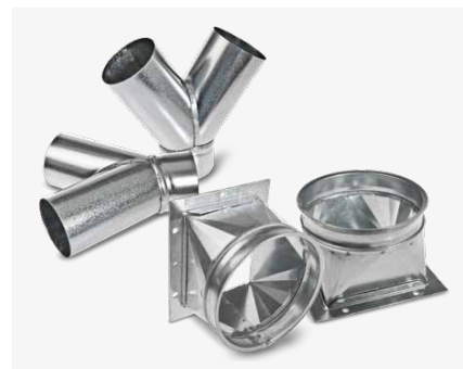
Accessori per impianti di aspirazione