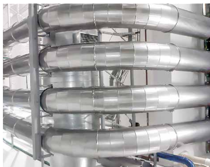
Tubazioni per trasporto pneumatico bottiglie Pipes for pneumatic bottle transport