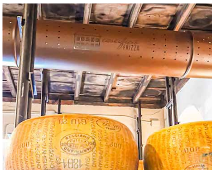
Impianti stagionatura formaggi Cheese maturing systems