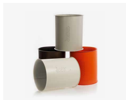
Tubazioni microforate Micro-perforated pipes