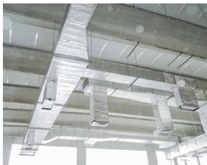
Impianti di condizionamento industriali