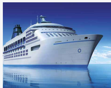
Condizionamento navale Naval air conditioning