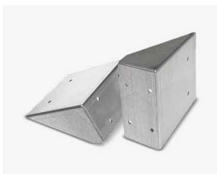
Lamierati di ogni tipo All types of sheet metal objects