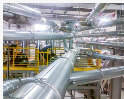
Impianti di aspirazione industriale