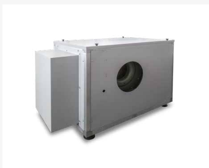
Carterature su misura Custom-made casings