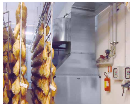
Impianti stagionatura prosciutti Ham maturing systems