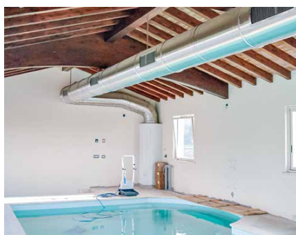
Impianti per piscine e palestre Systems for swimming pools and gyms